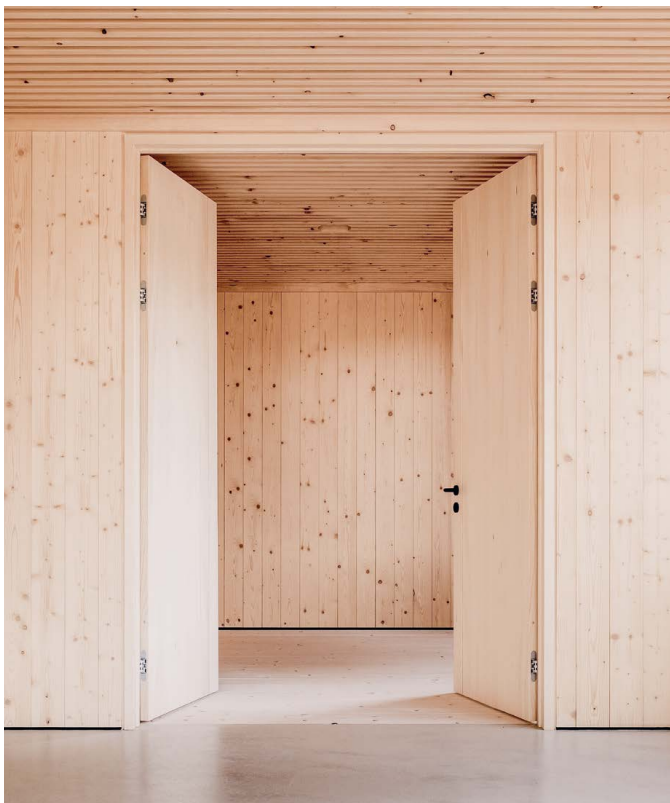
Porte de séparation à deux vantaux, revêtement intérieur avec revêtement en épicéa, classe d'aspect N1. [23]

Le choix du matériau n'entre pas dans les dispositions du droit des marchés publics. Les maîtres d'ouvrage qu'ils soient publics ou privés peuvent donc choisir dès le départ le bois comme matériau des aménagements intérieurs, indépendamment de la procédure d'appel d'offres requise. La décision de recourir à des matériaux renouvelables repose idéalement sur une stratégie établie. Pour ce faire, il est possible de se référer à la recommandation KBOB «Construction en bois dans la stratégie immobilière» [6].