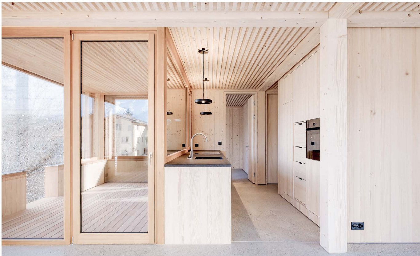
Cuisine sur mesure par le menuisier. [23]