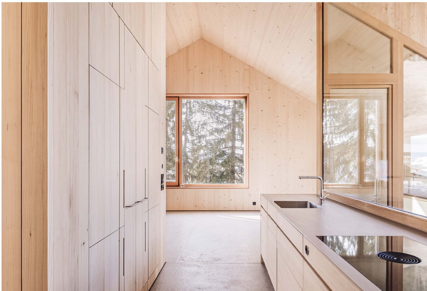
Aménagement intérieur de haute qualité en bois suisse. [23]