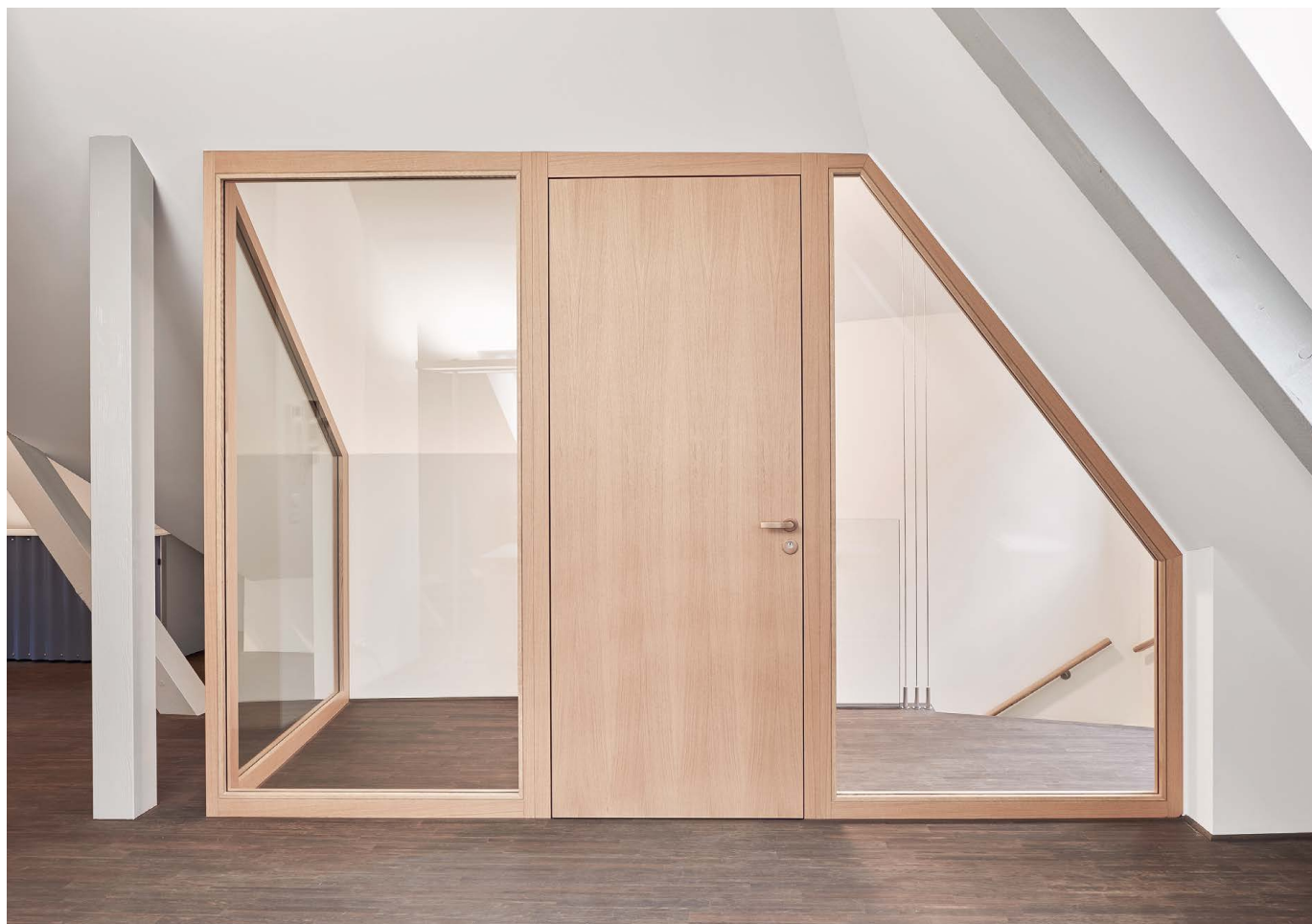
Porte coupe-feu avec vitrage fixe. [24]

Il est possible que certains produits – en particulier l'OSB ou les panneaux de fibres – ne soient pas fabriqués en Suisse.